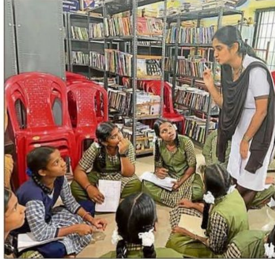
ಪುತ್ತೂರು ತಾಲ್ಲೂಕಿನ ಕಬಕದ ಗ್ರಂಥಾಲಯದಲ್ಲಿ ವಿಶೇಷ ತರಗತಿಯಲ್ಲಿ ಪಾಠ ಕಲಿಯುತ್ತಿರುವ ಮಕ್ಕಳು

'ಸರ್ಕಾರಿ ಶಾಲೆಯ ಮಕ್ಕಳನ್ನು ಸ್ಪರ್ಧಾತ್ಮಕವಾಗಿ ಬೆಳೆಸಿ, ಅವರ ಬೌದ್ಧಿಕ ಮಟ್ಟ ಹೆಚ್ಚಿಸುವ ಜತೆಗೆ, ಜೀವನ ಕೌಶಲ ಕಲಿಸುವ, ತಂತ್ರಜ್ಞಾನದ ಜ್ಞಾನ ಬಿತ್ತುವ ಆಶಯದೊಂದಿಗೆ