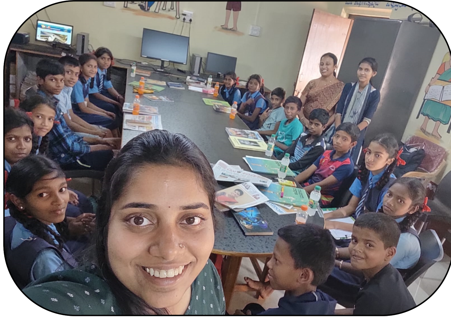
Aversa gram panchayat of Ankola, Uttara Kannada District