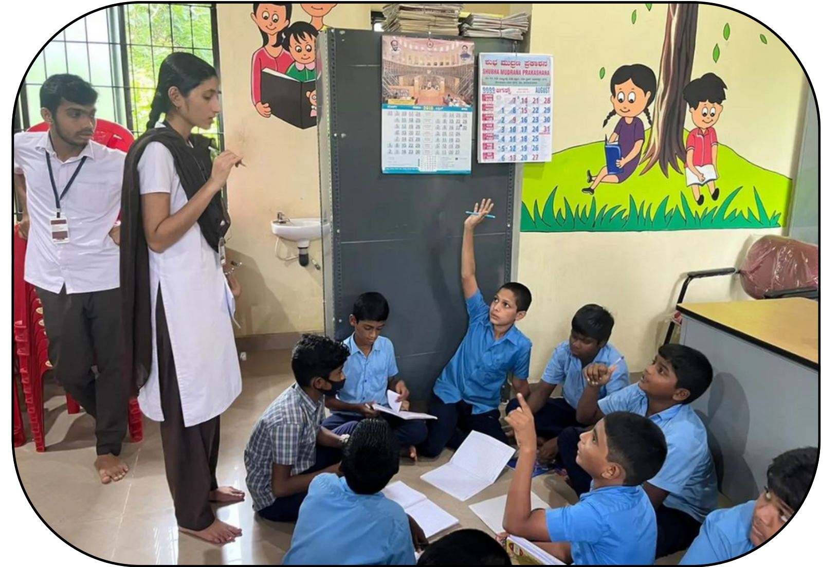
Kabaka gram panchayat, Puttur , Dakshina kannada